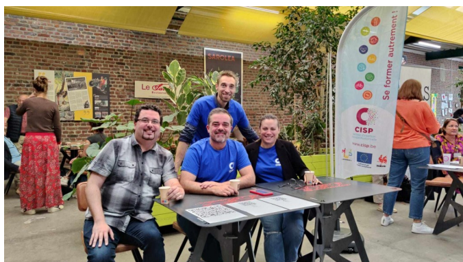
Les CISP de Liège au Forma Day à Herstal.

À travers une quarantaine d'actions, les CISP ont mis en lumière leur engagement quotidien auprès des personnes en parcours d'insertion sociale et professionnelle. Au programme : ateliers de formation, conférences et débats, portes ouvertes, et bien d'autres événements pour sensibiliser les partenaires et le grand public aux enjeux de l'insertion socioprofessionnelle.