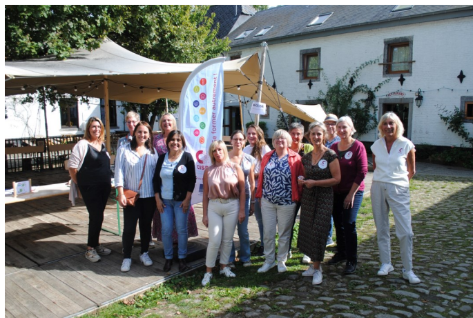
Les CISP du Brabant wallon au CISP'S DAYS à la Ferme de Froidmont.

Cette campagne d'action, intitulée "CISP en Action", s'est déployée avec force et conviction, avec plus d'une quarantaine d'initiatives variées et engagées. Ces actions se sont déroulées du 10 septembre au 10 octobre 2023, aux quatre coins de la Wallonie.