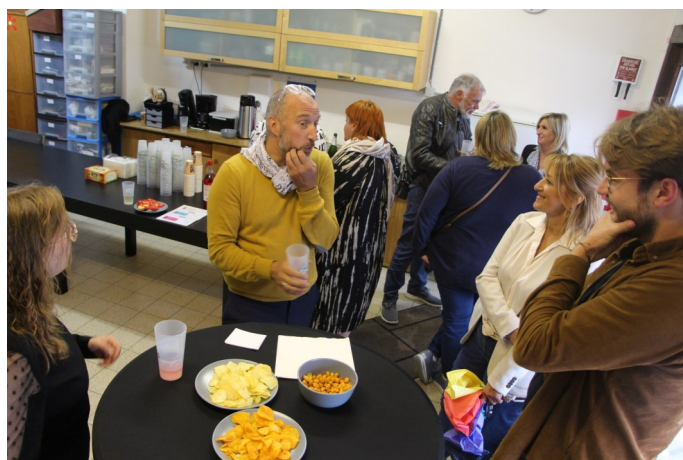
L'événement s'est clôturé avec un afterwork autour d'un verre.

De l'avis de l'équipe et des participant-e-s sur place, l'événement a été un succès. La richesse du contenu et la pertinence du sujet ont captivé les participant-e-s. L'idée prometteuse de reproduire cet événement dans d'autres centres, en vue d'une deuxième session, est à considérer. Ainsi, le partage et la diffusion de cette réflexion cruciale pourront se propager dans tout le réseau AID, favorisant des pratiques plus motivantes et un environnement d'apprentissage plus efficace.