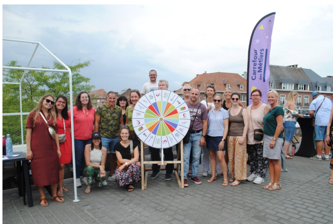
Les CIPS de Wallonie Picarde à la braderie de Tournai.

Dans un contexte marqué par une succession de crises telles que la pandémie de Covid-19, les inondations, l'augmentation des prix de l'énergie et l'inflation, les centres d'insertion socioprofessionnelle (CISP) revêtent une importance cruciale dans la lutte contre l'exclusion sociale et professionnelle. Face à ces défis, le réseau des CISP en Wallonie se mobilise de manière exceptionnelle pour rappeler leur rôle essentiel.